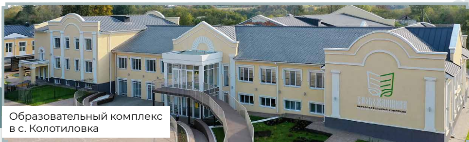
Образовательный комплекс в с. Колотиловка