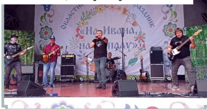
Фестиваль «На Ивана, на Купалу»