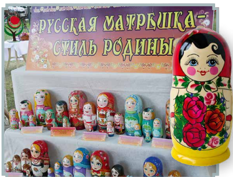
Матрёшка — один из символов Краснояружского края